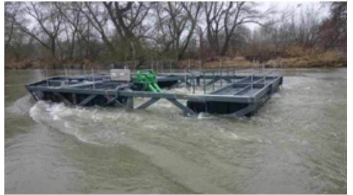
Hydrolienne en fonctionnement