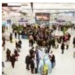
Les lauréats de "play your airport"