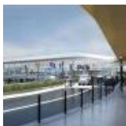
Programme de modernisation des aéroports parisiens