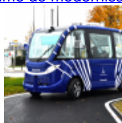
Express le cadre est fixé